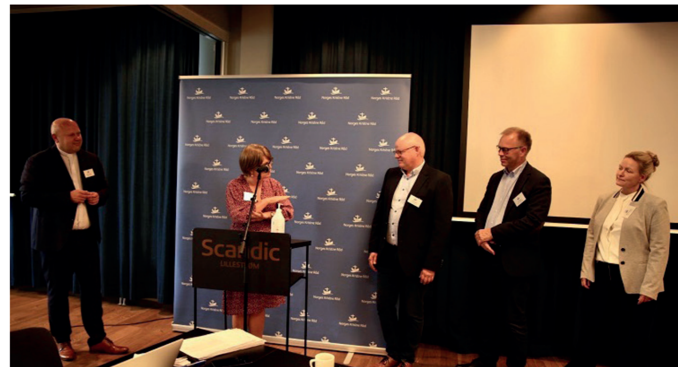
Fra rådsmøtet i Norges Kristne Råd, hvor BCC Norge ble tatt opp som fullverdig medlem 15. september

BCC Norge er samarbeidspartner med tankesmien Skaperkraft, som har som formål å stimulere til refleksjon, bidra til debatt og engasjere til aktiv samfunnsbygging. Tankesmien er inspirert av Bibelens grunnleggende verdier og klassisk kristen tenkning.